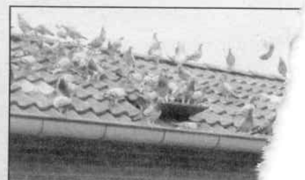
De toekomst van het hok Veugelers - zit op het a...